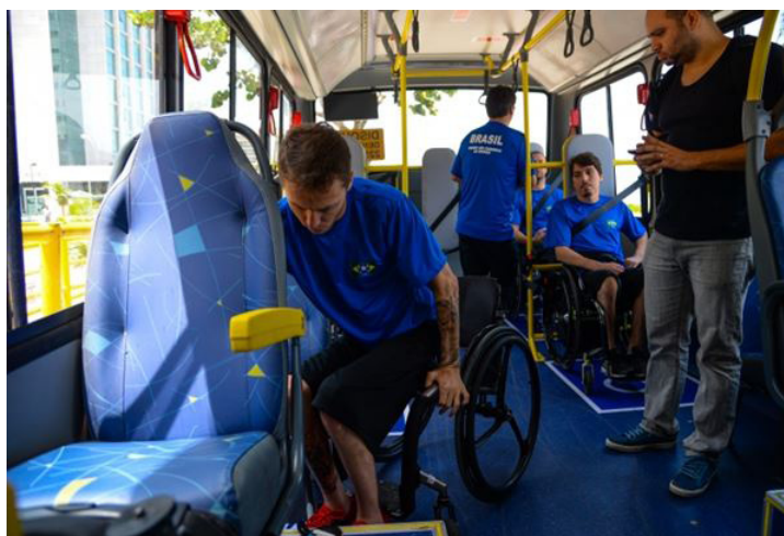
Ônibus acomoda até oito atletas em cadeiras de rodas, mais bancos para os que podem se deslocar