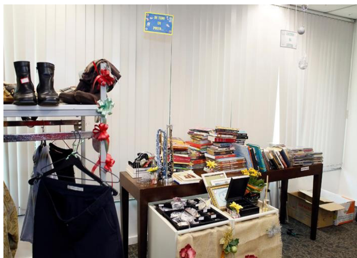
Roupas, sapatos, DVDs, fotografias, livros e até eletrodomésticos foram arrecadados.

Fonte: Ministério Público do Estado do Rio de Janeiro – 12/12/2014