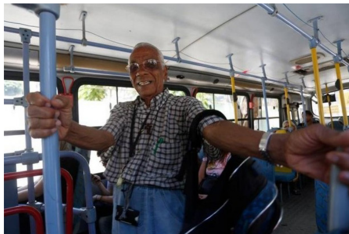
Idoso encontra assentos disponíveis em ônibus da linha 356

— Esses lugares amarelos não são para idosos. São para dorminhocos. Basta um velho entrar no ônibus para as pessoas fingirem que estão dormindo para não cederam o lugar.