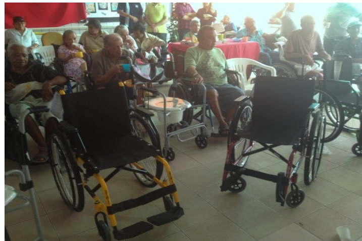
Cadeiras foram doadas ao abrigo através de linha de crédito da instituição