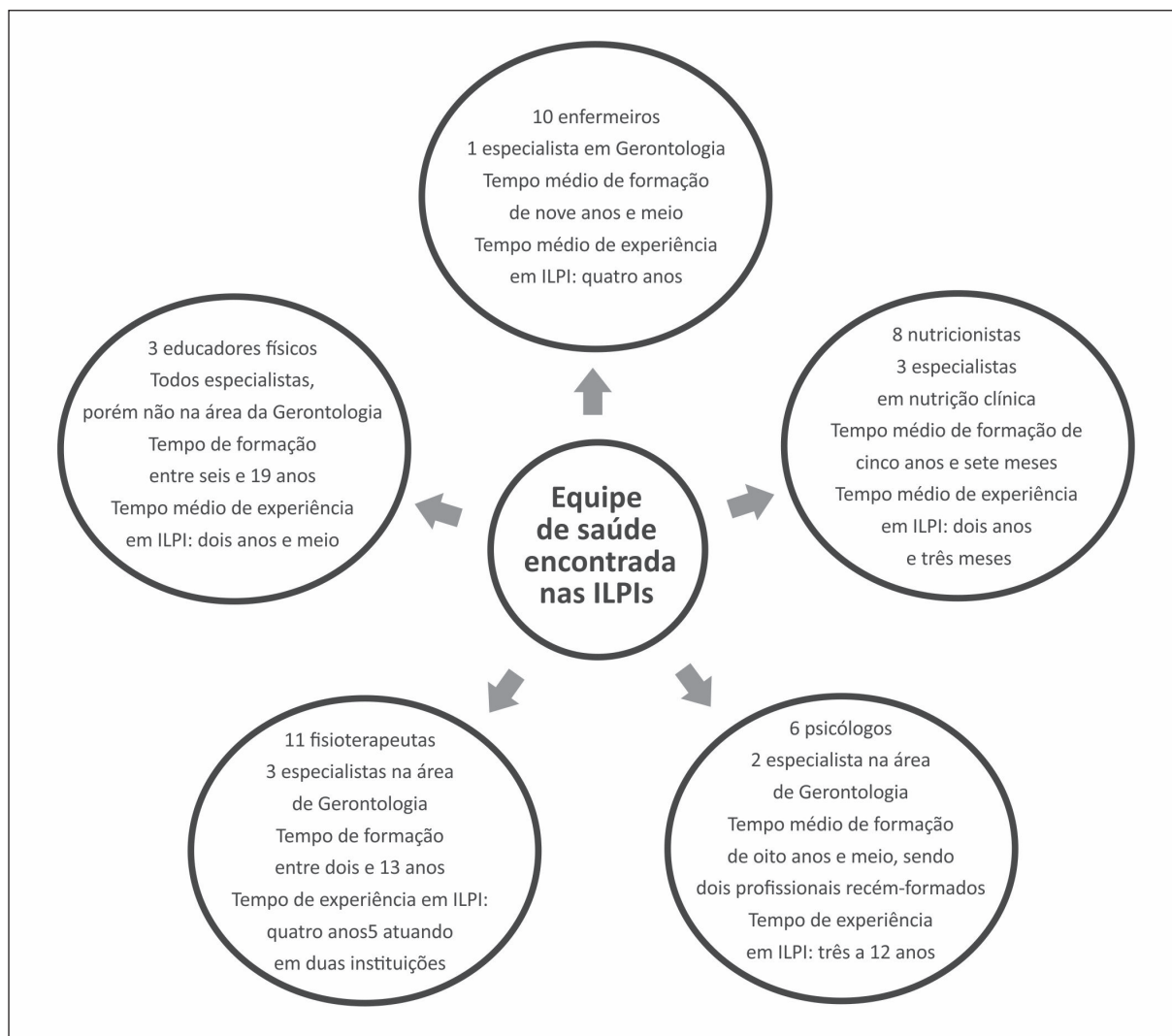
Figura 1. Caracterização das equipes de saúde das instituições de longa permanência para idosos. Passo Fundo-RS, 2013.

Aspecto importante demonstrado na figura 1 é quanto à composição da equipe multiprofissional, que ainda não é homogênea. Constata-se que o maior número de profissionais se dá entre os que desempenham a tarefa direta de cuidado e assistência, a cargo da equipe de enfermagem, que tem maior número de idosos sob sua atenção e maior número de horas de trabalho, o que está